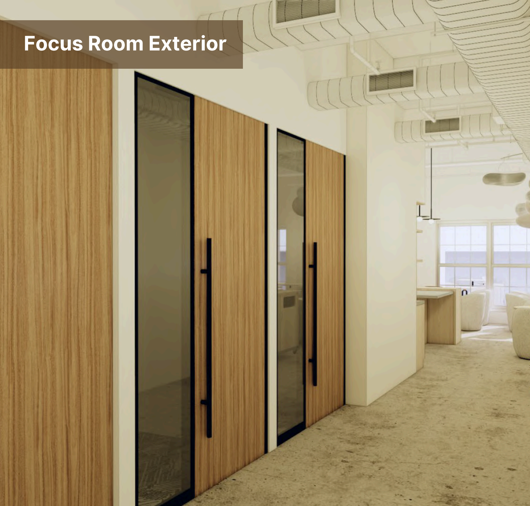
Focus Room Exterior